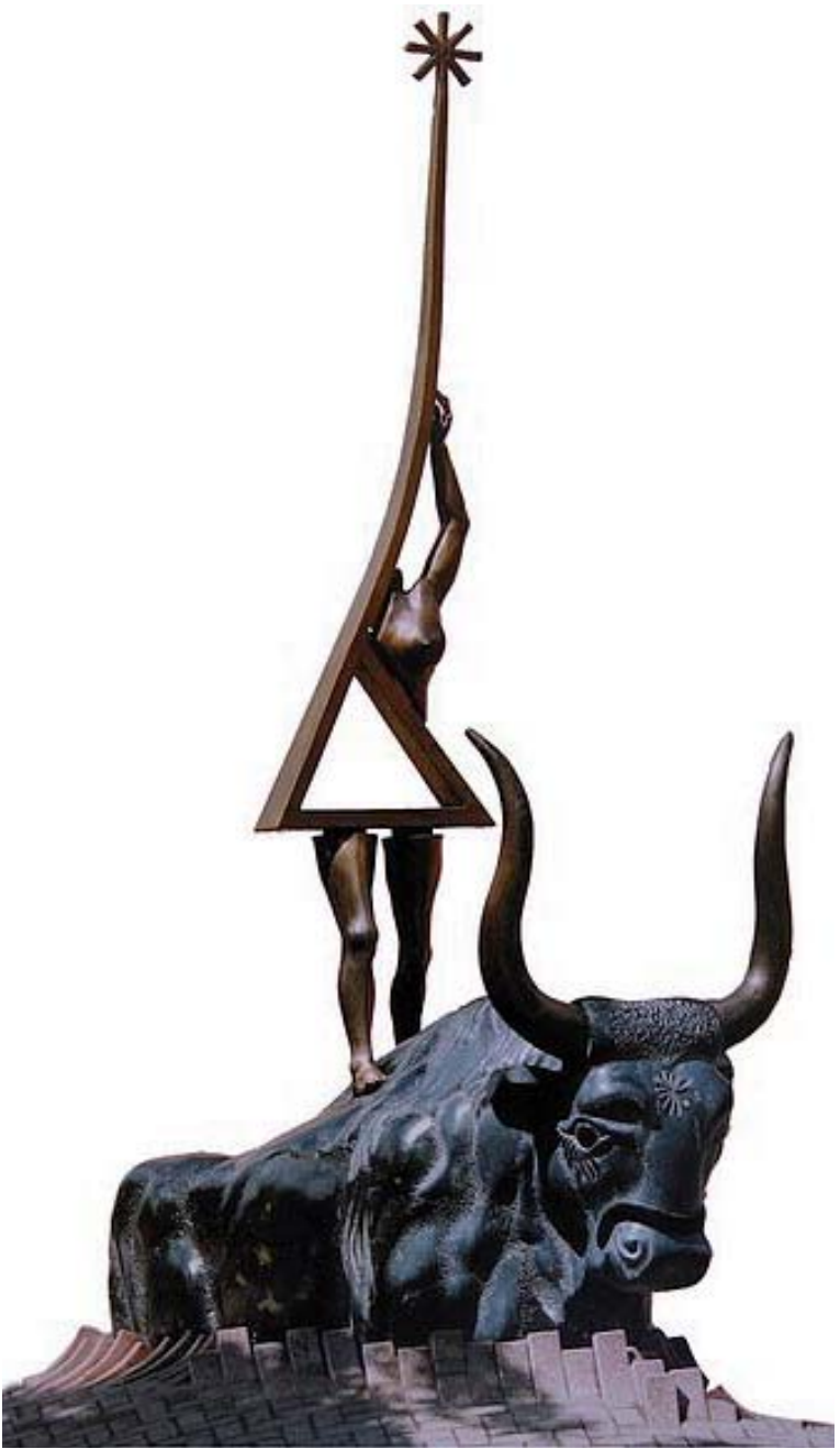
Für den Brückenbau in Europa